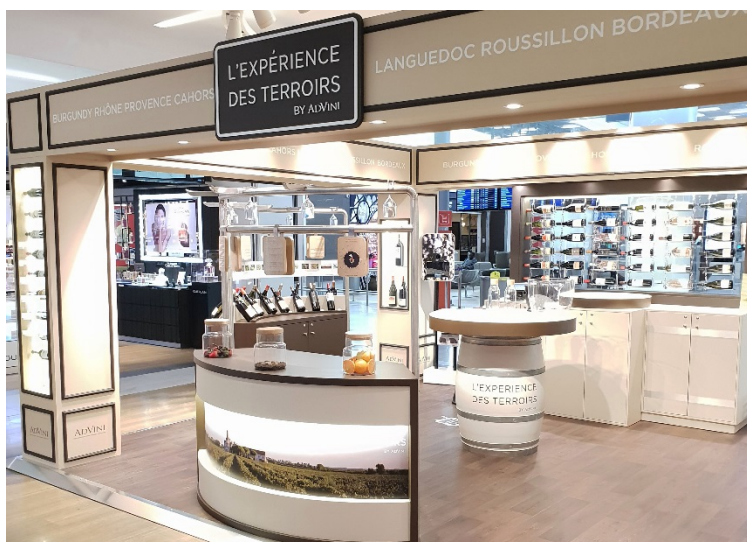
Vue générale du pop-up store.

Information pratique : Du 31 août au 1 er Octobre, Hall M du Terminal 2E