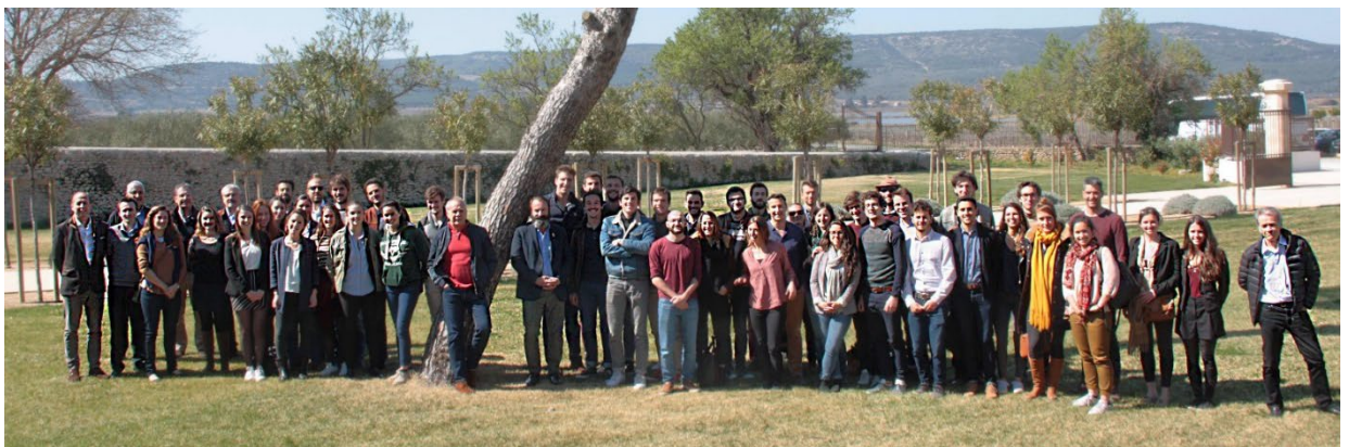
Photo à l'issue des auditions des 6 dossiers présélectionnés par le jury lors de la 4 ème édition du Concours Vignerons & Terroirs d'Avenir, au Domaine du Mas Neuf (Vignobles Jeanjean)

Par un don d'AdVini à SupAgro Fondation, ce concours est aujourd'hui doté d'une enveloppe de 70 000 euros de gains , reparti en deux prix de 50000€ et 20000€, et de journées de conseil. Il est organisé sous l'égide de la Fondation de Montpellier SupAgro.